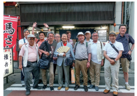
④日の高いうちから懇親会（人形町権兵衛）

締めは人形町の居酒屋・権兵衛で。一同、乾いた喉を潤し、大盛り上がりのうちに散開しました。次回、10回目も楽しみです。（堀川）