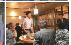
恒例の懇話での二次会