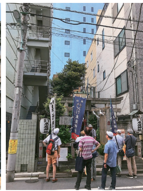
③葎原跡地の一角にある末広神社