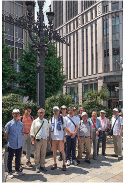
①日本橋・道路原票モニュメントよりスタート

さて一行はまず老舗商店を見ながら日本橋三越方向へ。コレド室町の裏手にある福德神社（別名「芽吹稲荷」）を参